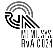
ISO9001, 14001 共通

RvA 認証マーク（新）の色は：黄土色：PMS 131 (DIC 567) 又はブルー：PMS 296 (DIC 434)