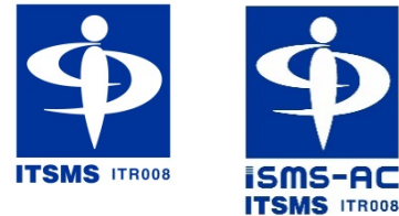
旧タイプ 新タイプ

3.3.4.3 ISMS-AC 認証マーク (ISO20000) 2020年4月1日以降、如何なる企業も本マークを使用する事は出来ない。