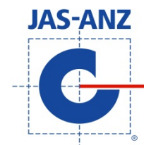
ISO9001, 14001 共通

3.3.6 JFS-C Certification Mark JFS-C certification mark can be reproduced in any size, however it is recommended to be greater than 12 mm in length. When black and white printing is unavoidable, the specified colours for black and white shall be used.