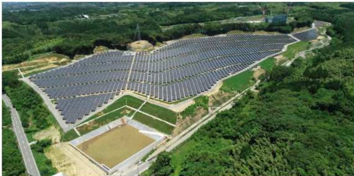
写真-1 プロジェクト SE-01 桑原城メガソーラー (No.4)