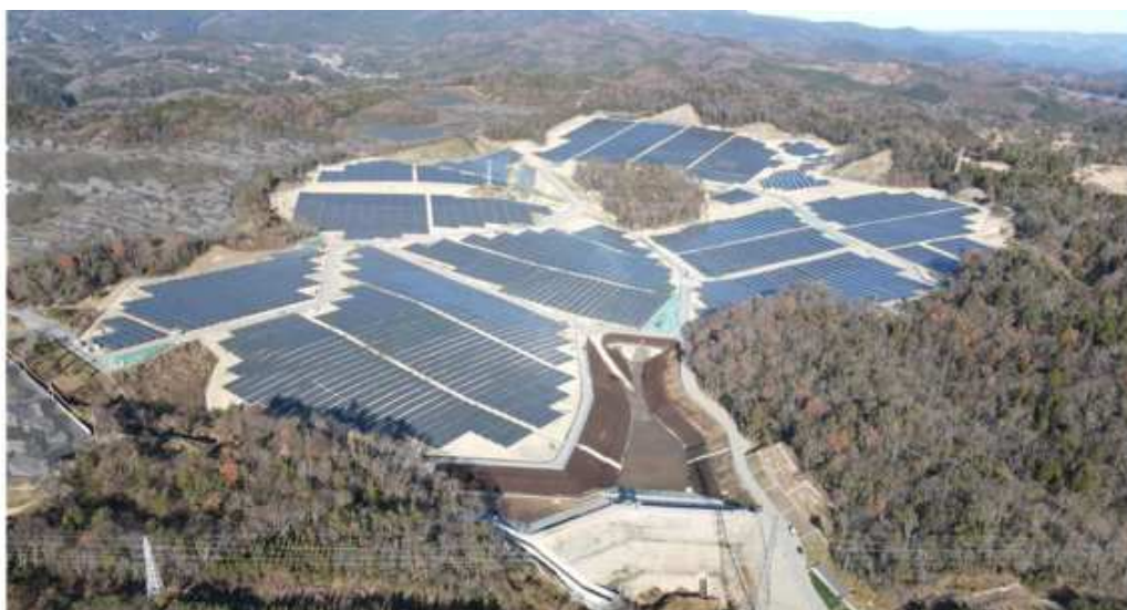
写真-2 プロジェクト SE-02 茨城県北茨城市磯原町特高発電所